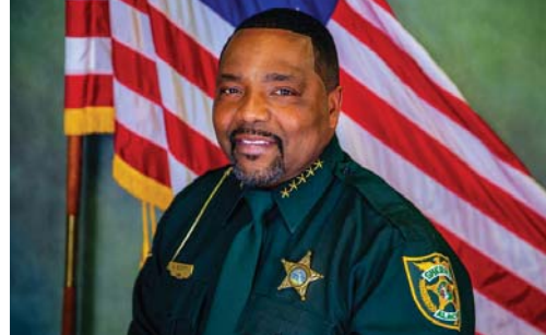
TRAIDO A USTED POR: