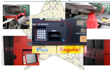
Clonador de Tarjetas de Crédito en una Gasolinera del Condado de Alachua

en fraudes. Los ladrones pueden usar los datos de tarjeta para hacer compras por teléfono o en línea, robar su identidad o crear tarjetas falsas.